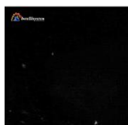
Con illuminatore spento